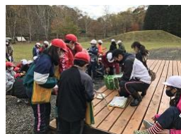
ネイチャーウォークラリー