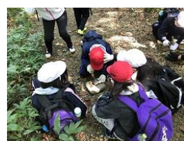
鉦石探し&アクセサリ作り