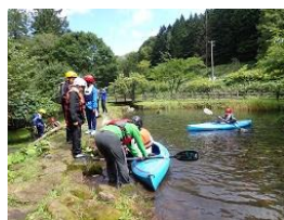
川の観察&じゃぶじゃぶ池遊び