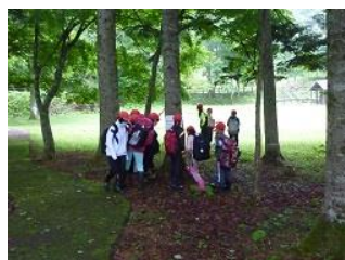
ネイチャーウォークラリー