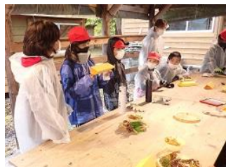
秋のランチプレート