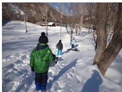
ネイチャーウォークラリー