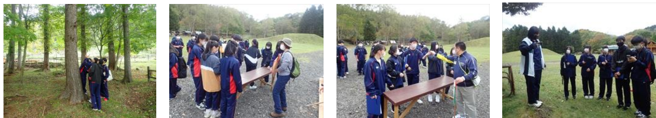
ネイチャーゲーム&今日のみっけ