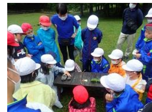
川遊び&リバートレッキング