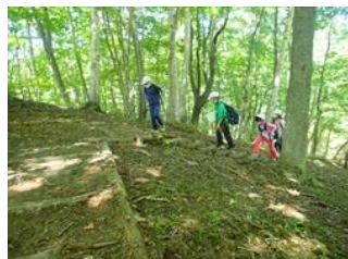
ネイチャーウォークラリー