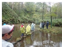
フットパスハイキング