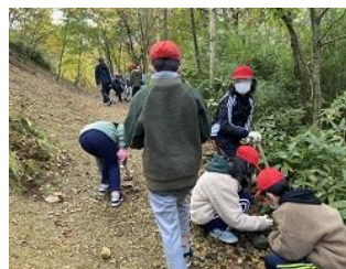
鉱石探し&アクセサリ作り