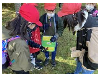
ネイチャーゲーム