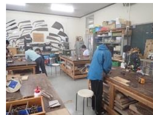
フォトフレームづくり