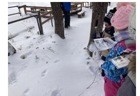
アニマルトラッキング