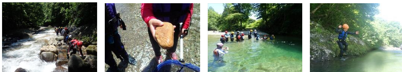
川遊び&リバートレッキング