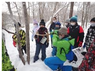
アニマルトラッキング