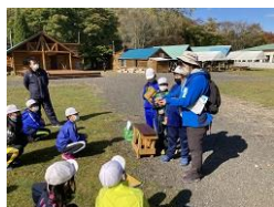
ネイチャーゲーム