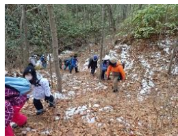
フットパスハイキング