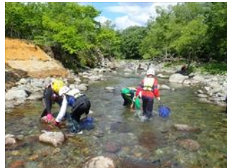
川遊び&リポートレッキング