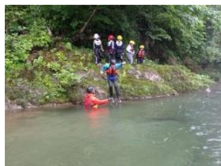
リバートレッキング・水生昆虫探し