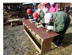
鉱石アクセサリ作り