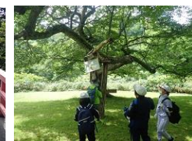
ネイチャーウォークラリー