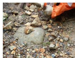
川遊び&プチリバートレ