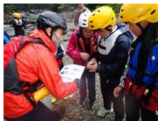
ネイチャービンゴ&生き物探し