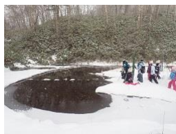
ウッドシェービング