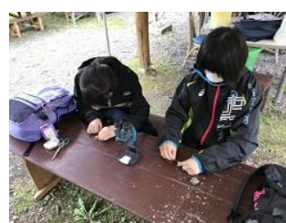
フットパスハイキング