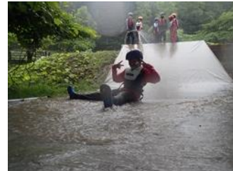
雨の日のネイチャーゲーム&じゃぶじゃぶ池遊び