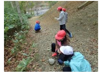
葉っぱ探しハイキング&鉱石探し